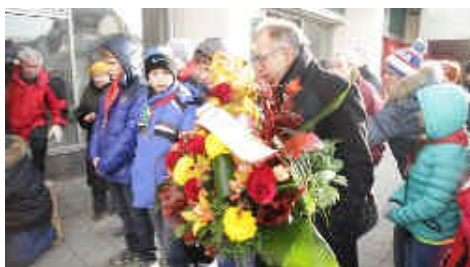
La délégation de l'association « France Europe Beslan » a déposé des gerbes de fleurs en hommage aux victimes de cet attentat.