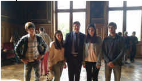
Visite de l'Hôtel de ville de Paris, organisée par l'Association Française des Victimes du Terrorisme AfVT.org.