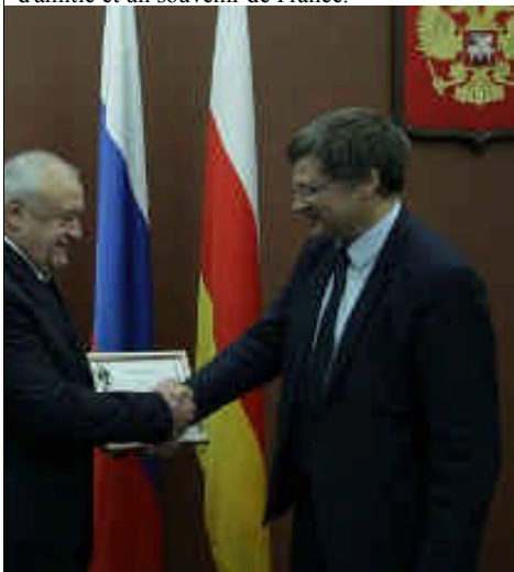
La république d'Ossétie du Nord remercie chaleureusement l'association « France Europe Beslan ».

Monsieur Taïmuraz MAMSUROV , Président de la République d'Ossétie du Nord a reçu ce jour l'association « France Europe Beslan » et l'association « Les Mères de Beslan ».