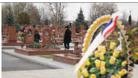
La délégation de l'association France Europe Beslan parcourt la Cité des Anges. En premier plan la couronne de fleurs de l'Association Française des Victimes du Terrorisme.