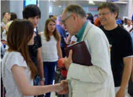
Accueil des jeunes de Beslan à l'aéroport de Paris CDG par une délégation de l'association « France Europe Beslan »