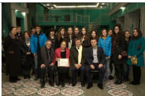
Les jeunes de Beslan avec les représentants de la Municipalité de Beslan, des associations « Les Mères de Beslan », « France Europe Beslan »