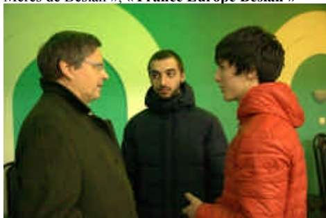
Rencontre avec deux des participants au projet « PAPILLON 2014 »