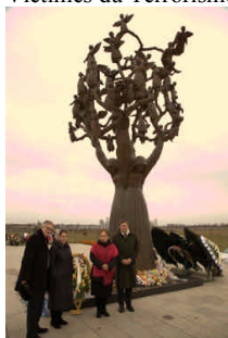
L'arbre du chagrin, logo de l'association « France Europe Beslan » est situé dans la Cité des Anges.