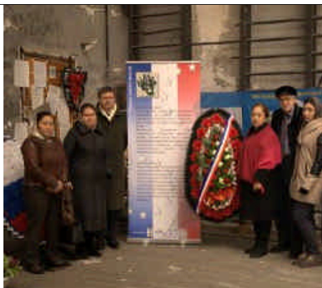
L'affiche et la couronne de fleurs déposées par « France Europe Beslan »