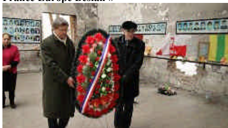
Couronne de fleurs déposée par « France Europe Beslan »