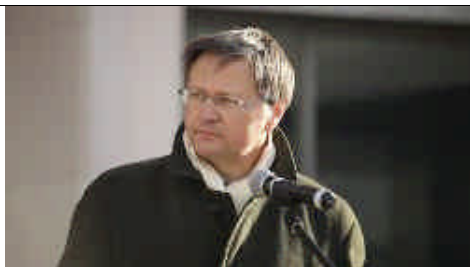
Hommage en mémoire des victimes par « France Europe Beslan ».